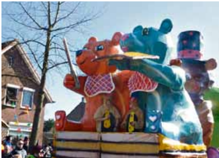
Carnavalsoptocht in Oldenzaal