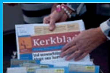
Ophalen Kerkblad door bezorgers bij de wijkhoofden