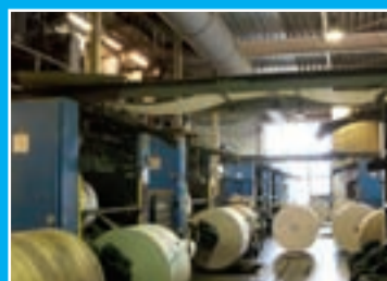
Het Kerkblad wordt gedrukt