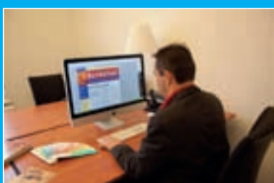
De vormgever aan het werk