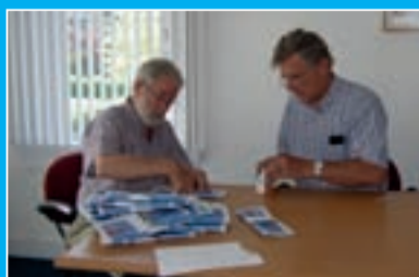
Versturen per post