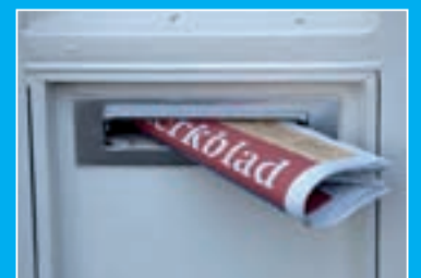
Kerkblad bij u in de brievenbus.